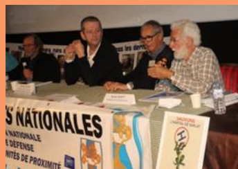
Sarlat, octobre 2021, délégation CODESHO